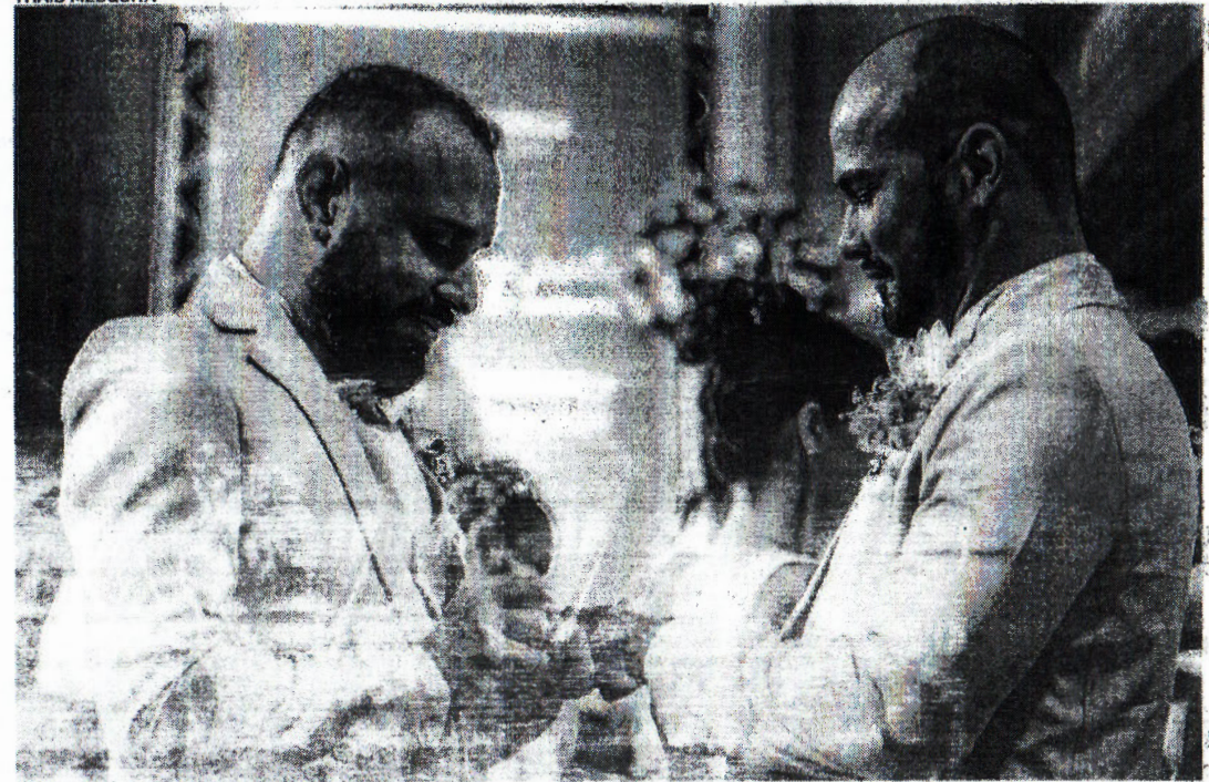
O CASAMENTO coletivo LGBTIA+ aconteceu no Teatro São José

Em casamento coletivo, 21 casais LGBT oficializam matrimônio | CELEBRAÇÃO | No Brasil, casamento LGBT tem a mesma validade e regularidade de