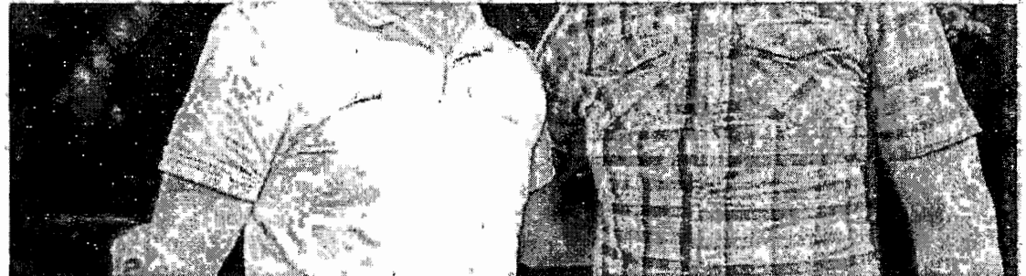
PREFEITO de Juazeiro tirou as dúvidas sobre quem apoiar na eleição

Estado do Ceará - Prefeitura Municipal de Potengi - Aviso de Licitação - Pregão Eletrônico Nº 2022.07.12-SS. O Pregoeiro Oficial do Município de Potengi, Estado do Ceará, torna público, que estará realizando certame licitatório, na modalidade Pregão Eletrônico nº 2022.07.12-SS, cujo objeto é a aquisição de 02 (duas) ambulâncias e 01(um) veículo da passeio zero km, conforme estabelecido nos Convênios 032/2022 e 53/2022, de interesse da Secretaria de Saúde do Município de Potengi/CE. O certame acontecerá na plataforma Bolsa de Licitações do Brasil - BLL, no endereço eletrônico www.bll.org.br, conforme especificações apresentadas junto ao Edital Convocatório e seus anexos, com abertura marcada para o dia 27 de julho de 2022, a partir das