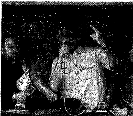
Bolsonaro durante 7 de setembro de 2021

Em plena ditadura, Médici fez do 7 de Setembro um dia