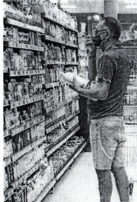
LEVANTAMENTO envolveu 70 produtos

ESTADO DO CEARÁ - PREFEITURA MUNICIPAL DE RERIUTABA - Título: AVISO DE QUALIFICAÇÃO COMO ORGANIZAÇÃO SOCIAL NA ÁREA DA SAÚDE NO MUNICÍPIO DE RERIUTABA/CE - Unidade Administrativa: Secretaria Municipal de Saúde - Regente: Comissão de Qualificação das Organizações Sociais. - Processo Originário: CHAMAMENTO PÚBLICO Nº SS-CH001/2022 - Objeto: Seleção de pessoas jurídicas de direito privado, sem fins lucrativos, constituídas sob forma de fundação, associação ou sociedade civil, para se qualificarem com Organização Social de Saúde - OSS com finalidade de específica de eventual e futura operacionalização da gestão e execução das atividades assistenciais e serviços de saúde a serem desenvolvidos no Hospital e Maternidade Rita do Vale Rego, CAPS, Centro de Especialidades Médicas e Unidades de Atenção Primária à Saúde, no âmbito do Município de Reriutaba/CE - Qualificados: INSTITUTO DE APOIO AO DESENVOLVIMENTO DA VIDA HUMANA, portador de CNPJ nº 21.843.341/0001-07, e o INSTITUTO 1º DE MAIO DO TRABALHO, DA SAÚDE E DO DESENVOLVIMENTO SOCIAL, CULTURAL E TECNOLÓGICO portador de CNPJ nº 13.609.281/0001-26 - Comunicado: A partir da data de publicação deste aviso, fica aberto o prazo recursal de 05 (cinco) dias úteis, ficando ainda informados os interessados que a Ata de julgamento encontra-se publicada no endereço eletrônico https://www.reriutaba.ce.gov.br - Presidente da Comissão de Qualificação das Organizações Sociais: FRANCISCO ANTONIO GERARDO DE ABREU ROCHA FILHO NETO.