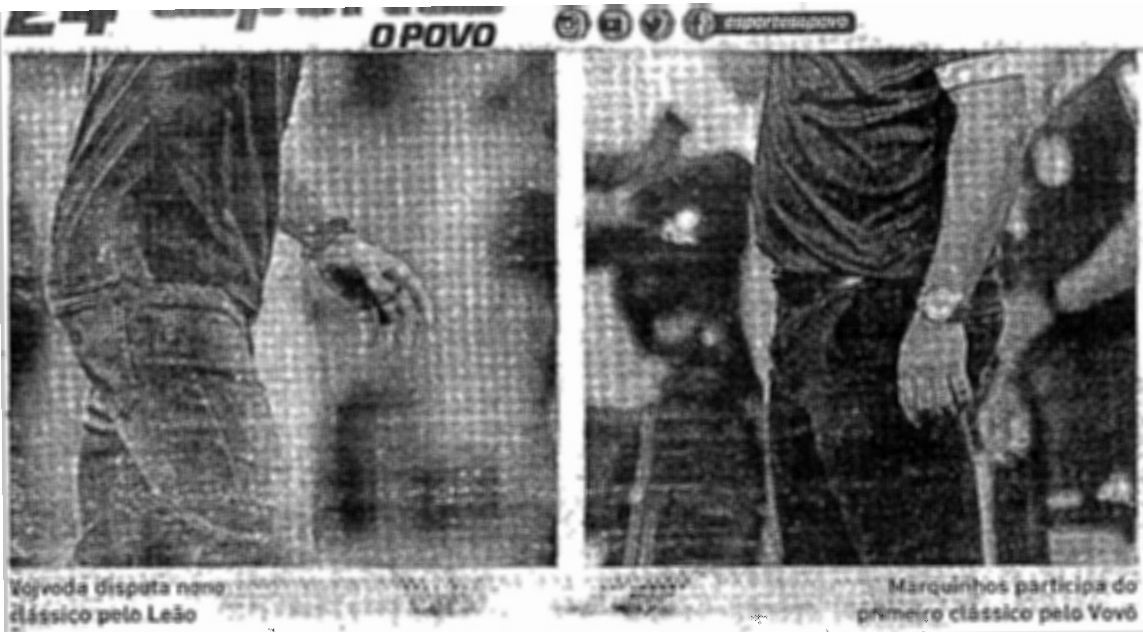
Vovoda disputa novo clássico pelo Leão