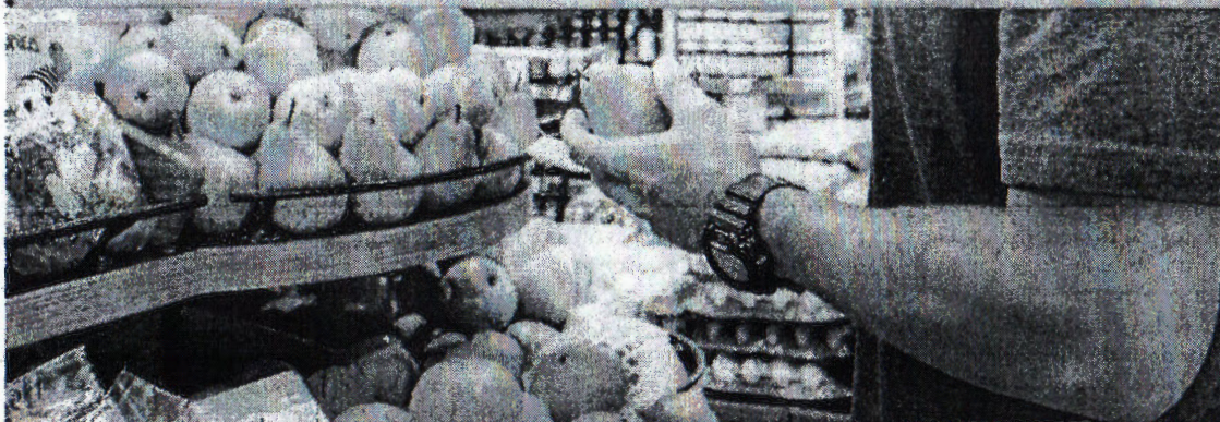
HORTIFRUTI é um dos primeiros segmentos a sentir a elevação