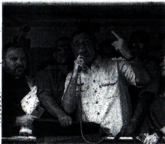
Bolsonaro durante 7 de setembro de 2021

Em plena ditadura, Médici fez do 7 de Setembro um dia