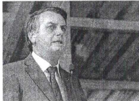
JAIR BOLSONARO sancionou pacote anticrime, com emenda de Marcelo Freixo